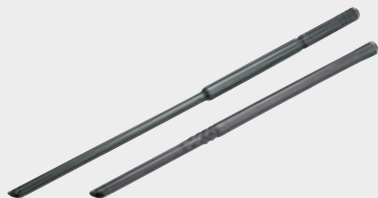
191X78-9 Duga mlaznica