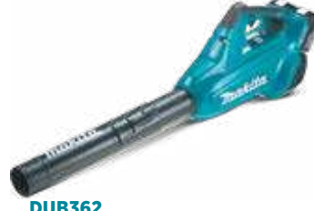
DUB362 18 + 18 V - LXT aku. duvaljka 194 km/h, 10,9 N