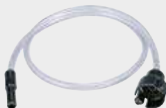
191X21-8 Mlaznica za uske prostore