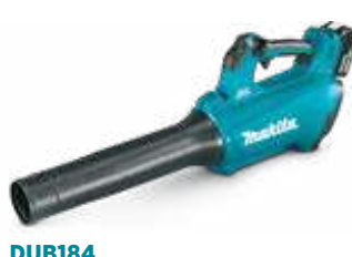
DUB184 18 V - LXT aku. duvaljka 194 km/h, 10,9 N