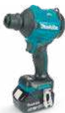
DAS180 18 V - LXT aku. duvaljka za prašinu 720 km/h, 2,8 N